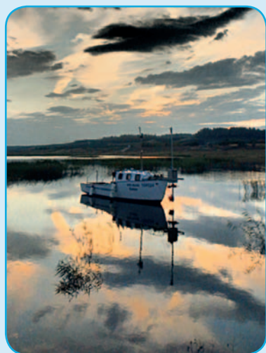
Výzkumné plavidlo Ota Oliva v přední části se sonarovými vysílači.

Počet běžících projektů a zakázek hlavní činnosti: . . . . . 44