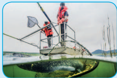
Odlov dravých ryb pomocí hlubinného elektrického agregátu.

Počet publikací v impaktovaných časopisech za rok 2015: . . . . . 37