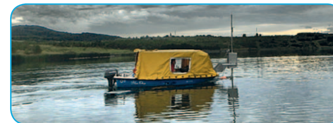
Výzkumné plavidlo provádějící kvantitativní průzkum rybií obsádky sonarovými vysílači.

Laboratoř ekologie ryb se zaměřuje na poznání vzorců časoprostorové distribuce ryb, horizontální a vertikální migraci, velikostně a druhově specifické využívání jednotlivých habitatů a dalších projevů chování. Sledujeme dostupnost potravních zdrojů pro ryby za různých podmínek, ale i ryby jako konzumenty živící se na nižších trofických úrovních, včetně důsledků pro kvalitativní složení těchto úrovní a kvalitu vody a rybářství. Uplatňujeme jak přístupy individuální, tak přístupy založené na zhodnocení vlivu celého společenstva. Zkoumáme a vyvíjíme metody pro kvantitativní vzorkování rybích obsádek.